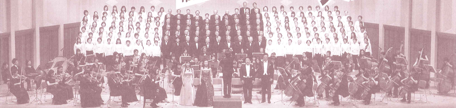
第31回 (2013年12月14日)