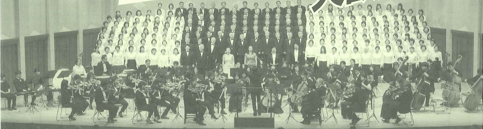
第34回 (2016年12月10日)