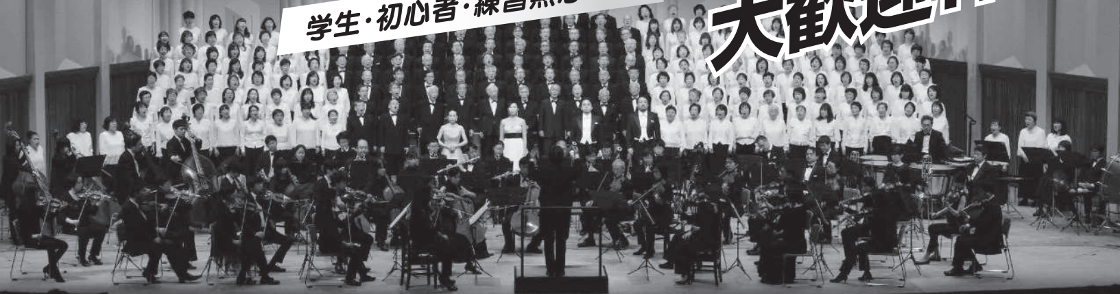
第35回 (2017年12月16日)