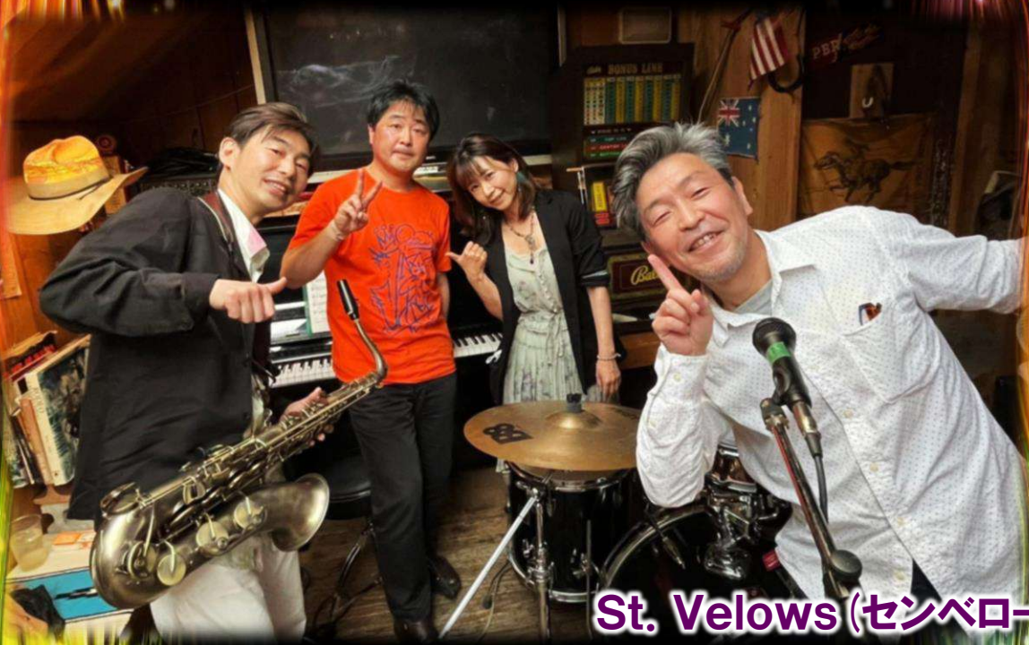
St. Velows (センペローズ)

無料(事前予約制) 会員 先行予約:9/14(水) 一般:9/16(金) ※詳細下記参照