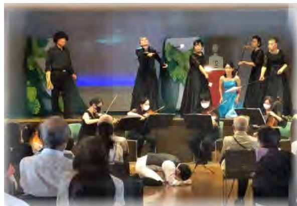
「夜の女王のアリア」等の名曲を「エエとこどり」で